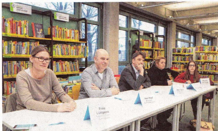
Die neun Sieger der Velberter Schulen mussten sich in der Stadtbücherei einer Jury stellen, die dann den Stadtsieger ermittelte.

■ Nach dem Kreisentscheid in Wülfrath folgen Bezirks- und Landesebene, bis einer der Teilnehmer schließlich beim Bundesentscheid gewinnt.